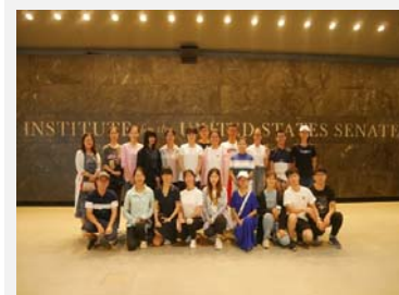
肯尼迪政法研究中心